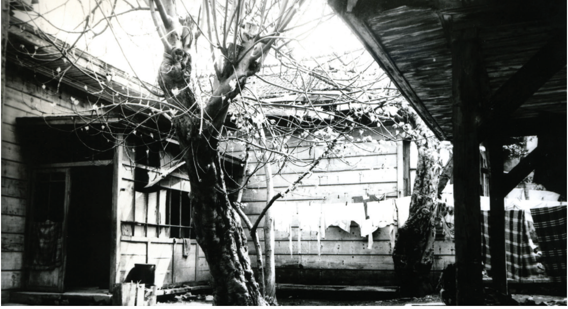
Camii - Tevhidhane Avlusu

batı duvarında da devam ederek hünkâr mahfili çıkmasının alın tahtalarıyla bütünleşmektedir.