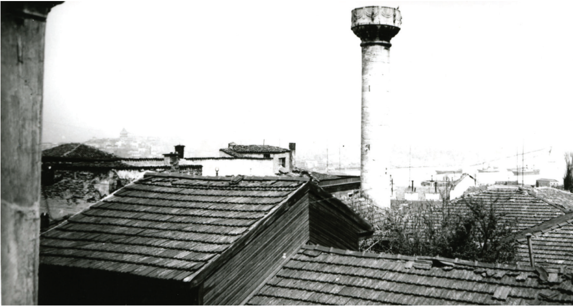
Camii - Tevhidhane Minaresi

Harem ve selâmlık bölümlerine bitişik olan batı duvarı elimizdeki fotoğraflarda ancak kısmen görülebilmektedir. Duvarın, fevkânî mahfile komşu olan kuzey kesiminde alt sırada pencere bulunmamakta, buna karşılık üst kesiminde, ortada hünkâr mahfilinin kavisli çıkması, bunun sağında (kuzeyinde) da dikdörtgen bir pencere görülmektedir. Bu pencere herhalde, hünkâr mahfilinin gerisinde yer aldığı tahmin edilebilen hünkâr dairesine açılmaktaydı. Aslında duvarın alt kesiminde, doğu duvarındakilerin eşi olan dört adet dikdörtgen pencerenin sıralandığı, sonradan, harem ve selâmlık bölümlerinin cami-tevhidhanenin batı duvarına bitişik olarak inşa edilmeleri sırasında söz konusu pencerelerin örülerek iptal edildikleri varsayılabilir. Belki bunlardan bir tanesinin kapıya dönüştürülmesi suretiyle selâmlıkla cami-tevhidhane arasında bağlantı sağlanmıştı. Cami-tevhidhanenin kuzeyindeki fevkânî mahfilin alın tahtaları, kat arası silmesi şeklinde