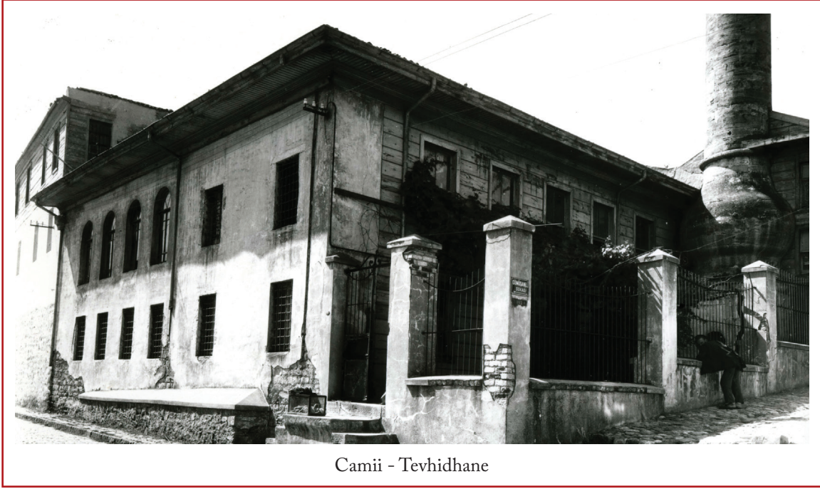
Camii - Tevhidhane

Son cemaat yerinde, kuzey duvarının ekseninde, cami-tevhidhanenin dış kapısı, bunun yanlarında ikişer tane dikdörtgen açıklıklı giyotin pencere yer almaktadır. Fotoğraflarda iyi seçilemeyen bu kapının dikdörtgen biçiminde olduğu ve aynı duvardaki pencereler gibi süslemesiz ahşap pervazlarla kuşatıldığı tahmin edilebilir. Cephenin üst kesiminde, son cemaat yerinin üstünü işgal eden fevkânî mahfile ait, aynı türde beş pencere sıralanır. Bunlardan ortadaki kapının üzerine, yandakiler de alttaki pencerelerin üzerine isabet etmektedir. Son cemaat yeriyile fevkânî mahfilin doğu yönünde sınırlayan kâgir duvarda da, aynı dikey eksenler üzerine yerleştirilmiş ikişer adet dikdörtgen pencere bulunur. Bu pencereler, sonradan üstlerinin sıvandığı anlaşılan, kesme köfekiden sövelerle çerçevenilmiş ve lokmalı demir parmaklıklarla donatılmıştır. Son cemaat yerinin, harem dairesine ve fotoğraflarda görünmeyen batı duvarının sağır olduğu düşünülebilir. An-