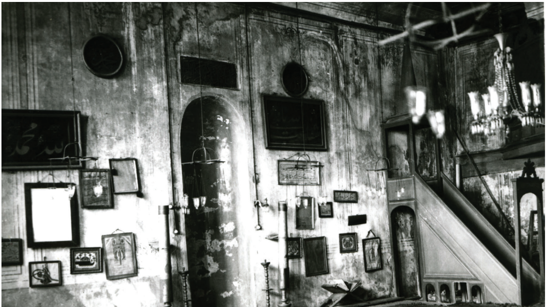
Camii - Tevhidhane Mihrab ve Duvarı

Fatma Sultan Camii tekkeye dönüştürüldükten sonra da aslı kullanımını sürdürmüş, ancak bundan böyle dervişlerin hatm-i haccân icra ettikleri tevhidhane görevini üstlenerek cami-tevhidhane kimliğine bürünmüştür. Cami-tevhidhanenin batı yönüne 1875 (1292)'te harem ve selâmlık bölümlerinin eklenmesi sonucunda, Gümüşhânevî Tekkesi, bir tarikat kuruluşunun gerektirdiği mimari programa ka-