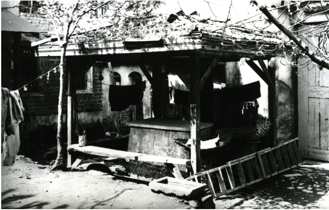
Camii - Tevhidhane Avlu ve Şadırvan

cerelerin sıralandığı bu kesimde mutfak, kiler, taamhane (yemekhane), gusülhane gibi servis birimlerinin yer aldığı tahmin edilebilir. Ahşap duvarlı olan üçüncü kattan, Gümüşhaneli Sokağı'nın kuzey-güney doğrultusunda uzanan kesimine açılan iki adet dikdörtgen pencere mevcuttur. Marsilya kiremitleriyle kaplı bir beşik çatının örttüğü batı kanadının güney kesimi ise iki katlıdır. Dervişlerin ve misafirlerin barınmasına tahsis edilen birimlerin (derviş hücreleriyle mihman odalarının) bu kanatta yer almaları mümkündür. Aynı şekilde iki katlı olan güney kanadında, cami-tevhidhaneye bitişik olan doğu kesiminin hünkâr mahfiliyle bağlantılı hünkâr dairesini barındırdığı muhakkaktır. Şeyh efendinin misafirleri kabul ettiği ve sohbet toplantıları düzenlediği şeyh odası da büyük bir ihtimalle güney kanadında, hünkâr