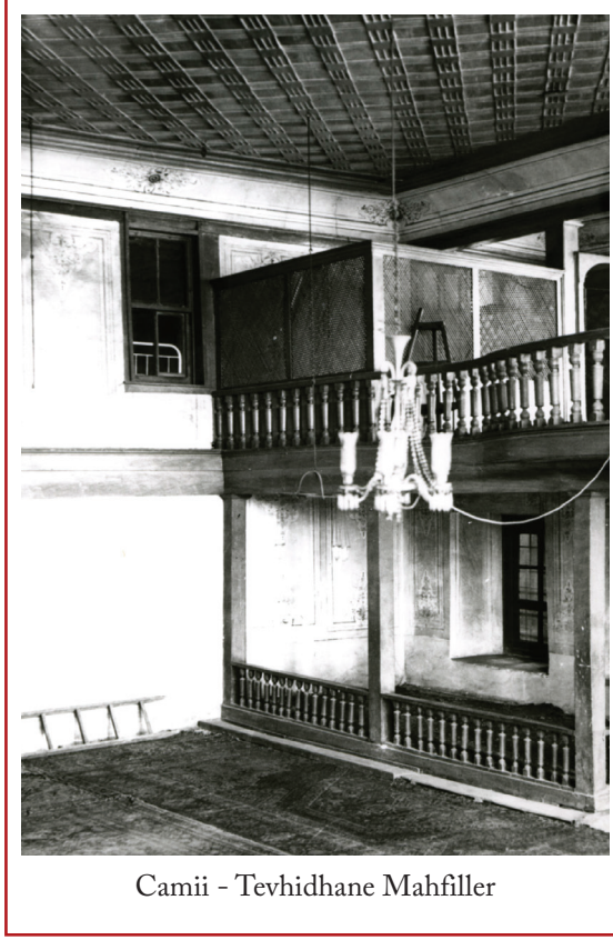
Camii - Tevhidhane Mahfiller

uygun olarak verrev konumdadır. Enli ve profilli çitalarla (pasalarla) iki kare çerçeve meydana getirilmiş, içteki çerçeve, yuvarlak küçük bir göbekten dağılan oniki adet iri yaprakla doldurulmuş 1 , böylece II. Mahmud döneminde çok yaygın olan ve “Sultan Mahmud güneşi” tabir edilen ışınsal süsleme elde edilmiştir. Fevkânî mahfilde de buna benzer bir tavanın bulun-